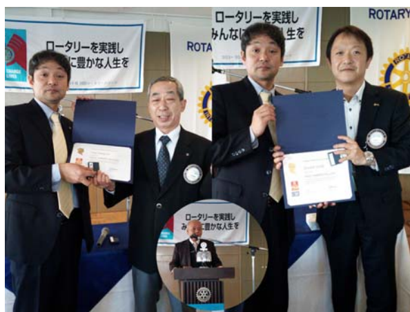
2014年1月9日(木) 第1766回例会