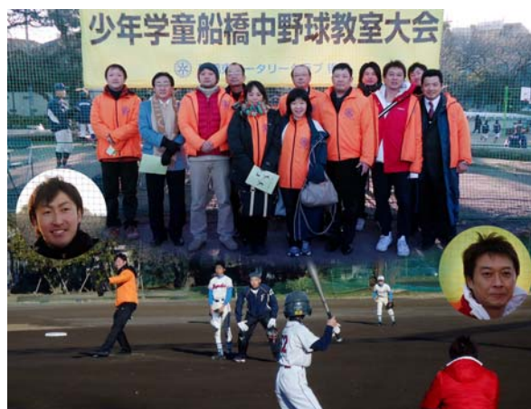
2014年1月11日(土) 第7回船橋中野球教室 始球式 (元読売ジャイアンツ 土本恭平投手) (元ヤクルトスワローズ 城友博外野手)

第1766回例会 2014.1.9 晴 司会 山口会員 国歌「君が代」 ロータリーソング 「奉仕の理想」